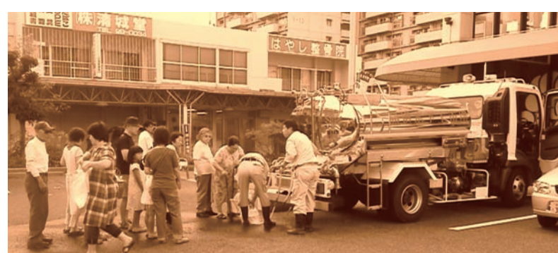
給水車による給水 桃山台近隣センター駐車場にて

に立った日韓の話し合いのテーブルがないことが問題。⑦尖閣列島と竹島問題は性格が異なり解決方法も異なるが、緊張を激化させるような行動は双方が慎まないと問題の解決にならない。