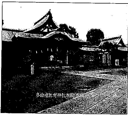
多治速比売神社(重要文化財)

八月二十七日(日)に「南区見て歩きツアー」が行われることになりました。これは、「集い」を準備している中で、南区ってどんな街だろうと話し合い、かつて須恵器の大生産地帯であったことや重要文化財や指定文化財などがたくさんある歴史の古い街。計画的に造られ整った街