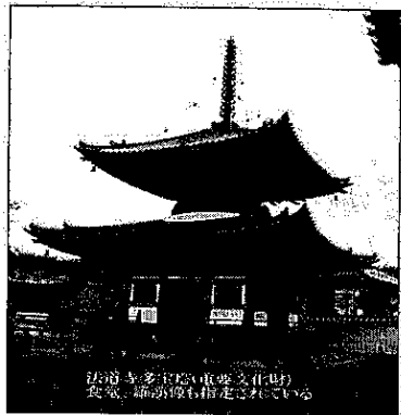
多治速比売神社(重要文化財) 祭具、祭具庫、指輪などが展示されている

八月二十七日(日)に「南区見て歩きツアー」が行われることになりました。これは、「集い」を準備している中で、南区ってどんな街だろうと話し合い、かつて須恵器の大生産地帯であったことや重要文化財や指定文化財などがたくさんある歴史の古い街。計画的に造られ整った街